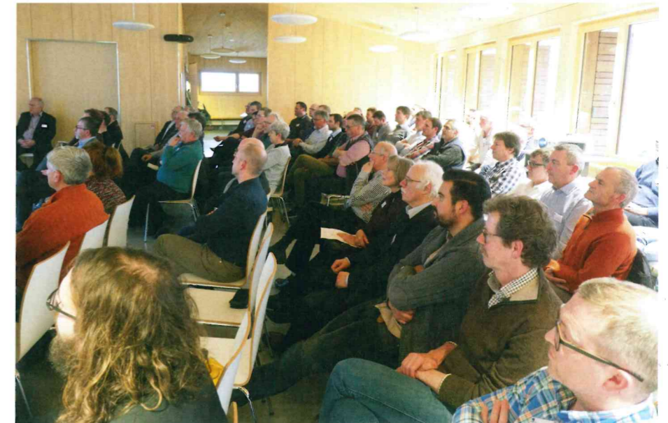
Knapp 80 Fachleute und Politiker liessen sich aus erster Stelle über wichtige Themen und Anliegen der Holzbranche informieren.

Der Spezialist wies auch auf die In-house-Beschaffung hin: Wenn Kantone oder Gemeinden bei der Ausschreibung von Gebäuden das zu verarbeitende Holz aus eigenem Wald zur Verfügung stellen, verstosse dieses Vorgehen nicht gegen das Welthandelsabkommen (WTO). Dies praktiziere zurzeit der Kanton Bern beim Bau des Campus für die neuen Gebäude der Berner Fachhochschule in Biel. Trotzdem gelte ganz generell: Die öffentliche Verwaltung ist sich immer noch zu wenig bewusst, was der Holzbau auch technisch kann. Nach neuem Beschaffungsrecht wird die ausschreibende Stelle ausserdem verpflichtet sein, bei ungewöhnlich niedrigen Angeboten nachzufragen, wie dieser